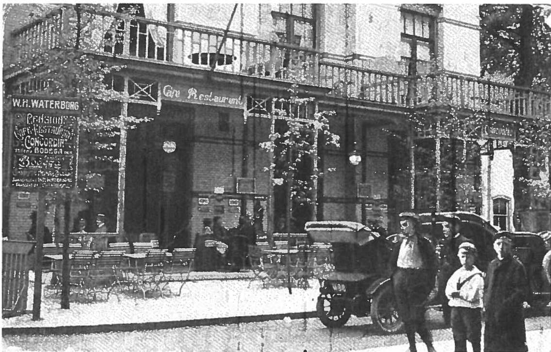
Café-restaurant Concordia op de hoek van de Utrechtseweg/ Prins Hendrikstraat

Hoewel de commissieleden nog diezelfde dag de commissaris een lijst toezonden van de deelnemers aan de vergadering van 6 december, met vermelding van hun beroep, om te laten zien 'dat hetgeen men U omtrent de aanwezigen had meegedeeld niet juist is', meende de commissaris in zijn brief van 9 februari aan de minister dat zij 'nu juist niet tot de meest bezadigde elementen der bevolking behoren.' Het blijken vooral neringdoenden, handelaren, kasteleins, pensionhouders en ambachtslieden geweest te zijn, waar verder niets op aan te merken viel. Het waren echter geen heren, maar burgers die, op een enkele uitzondering na, niet als 'particulieren' van hun kapitaal konden leven.