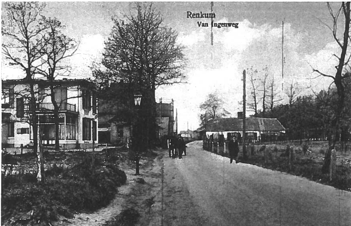
De Van Ingenweg te Renkum met op de achtergrond de gashouder van de plaatselijke gasfabriek